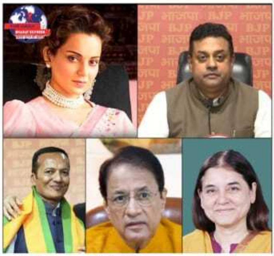
मंडी से कंगना, पुरी से संबित पात्रा, कुरुक्षेत्र से नवीन जिंदल, सुल्तानपुर से मेनका गांधी और मेरठ से अरुण गोविल पर भाजपा ने दिखाया विश्वास।